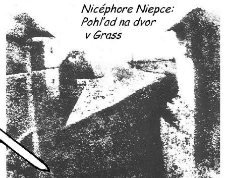
Nicéphore Niepce: Pohľad na dvor v Grass